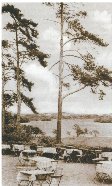
Udsigten fra pavillonplateauet.

”Så vidt turisten; vi 1) føjer hertil, at farten med en fortrinlig båd fra Bækkelund rundt om på den skønne sø kan ske til enhver tid og vil ikke fortrydes af nogen; der er på forskellige punkter både i bøgeskoven og ved ruinen anlagt landgangsbroer, hvorfra man kan foretage spadsereture til udsigtspunkterne. Der er nu i det hele gjort så meget for egnen ved Hald og for besøgendes bekvemmelighed, at det kun kan påskønnes. Dog tillader vi os at foreslå at der foran pavillonen på bakken endnu fjernes en del af de store fyrretræer og et par graner, der generer udsigten over søen og ingenlunde er til pryde. En beplantning nedenfor bakken og på skråningen af mindre træer, ville derimod være meget heldig og uden tvivl danne en smuk og virkningsfuld forgrund for landskabet.”