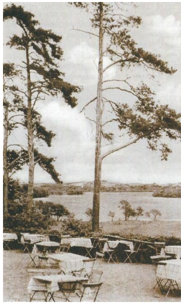
Udsigten fra pavillonplateauet.

”Så vidt turisten; vi 1) føjer hertil, at farten med en fortrinlig båd fra Bækkelund rundt om på den skønne sø kan ske til enhver tid og vil ikke fortrydes af nogen; der er på forskellige punkter både i bøgeskoven og ved ruinen anlagt landgangsbroer, hvorfra man kan foretage spadsereture til udsigtspunkterne. Der er nu i det hele gjort så meget for egnen ved Hald og for besøgendes bekvemmelighed, at det kun kan påskønnes. Dog tillader vi os at foreslå at der foran pavillonen på bakken endnu fjernes en del af de store fyrretræer og et par graner, der generer udsigten over søen og ingenlunde er til pryde. En beplantning nedenfor bakken og på skråningen af mindre træer, ville derimod være meget heldig og uden tvivl danne en smuk og virkningsfuld forgrund for landskabet.”