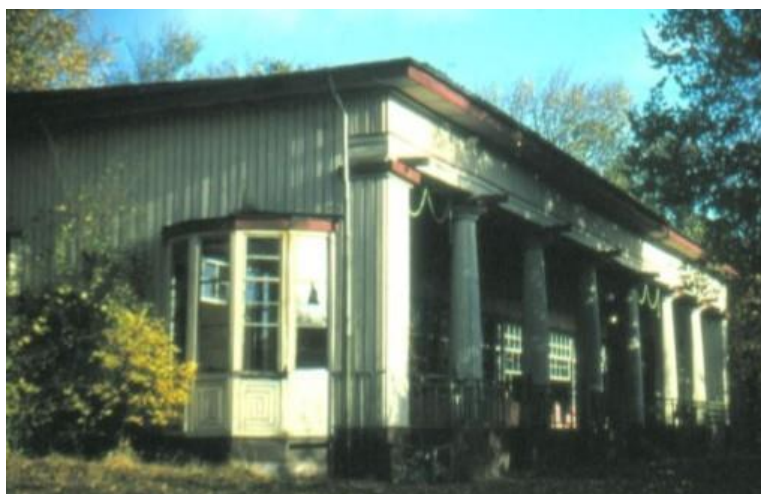
Foto fra 1969 af Pavillonen.