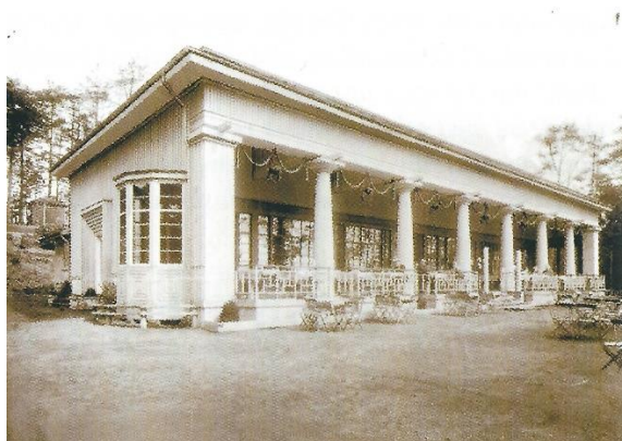
Den genopbyggede Pavillon

I 1914 brænder den, men genopbygges ved Rosens hjælp. Omkring 1970 nedrives pavillonen.